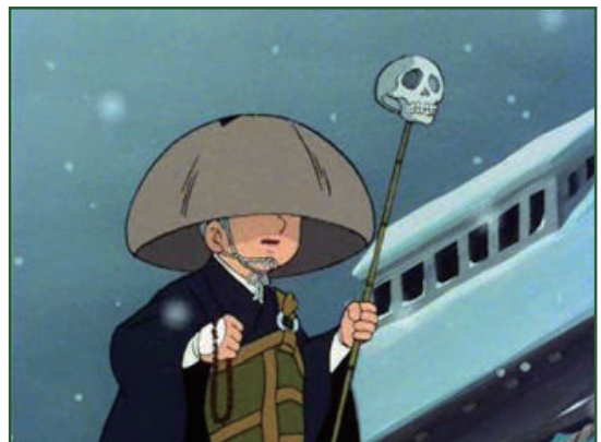
(アニメ一休さんより)