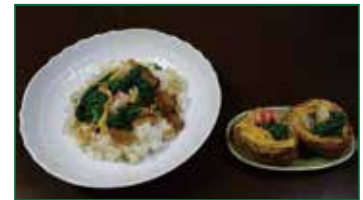
春らしい、色とりどりのちらし寿司♪